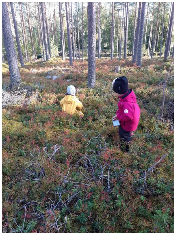
Kuva 4. Päiväkerholaisten marjankeruuastiat askarrettiin maitopurkeista.

(Toteutusaika: 2024–2029. Vastuhenkilöt: jätevästaaava, suntio, talouspäällikkö)