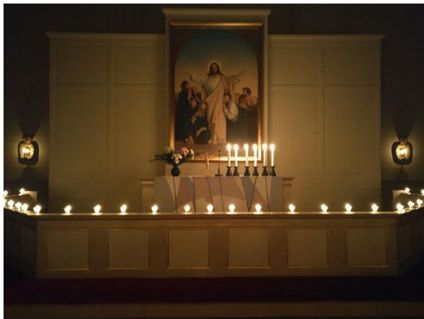
Kuva 2. Sievin seurakunnassa osallistutaan vuosittain Earth Hour -tapahtumaan.

Kirkko tavoittelee hiilineutraaliutta vuoteen 2030 mennessä. Se vaatii toimenpiteitä jokaiselta seurakunnalta. Sievin seurakunnan suunnitelma kohti hiilineutraaliutta on muotoutumassa.